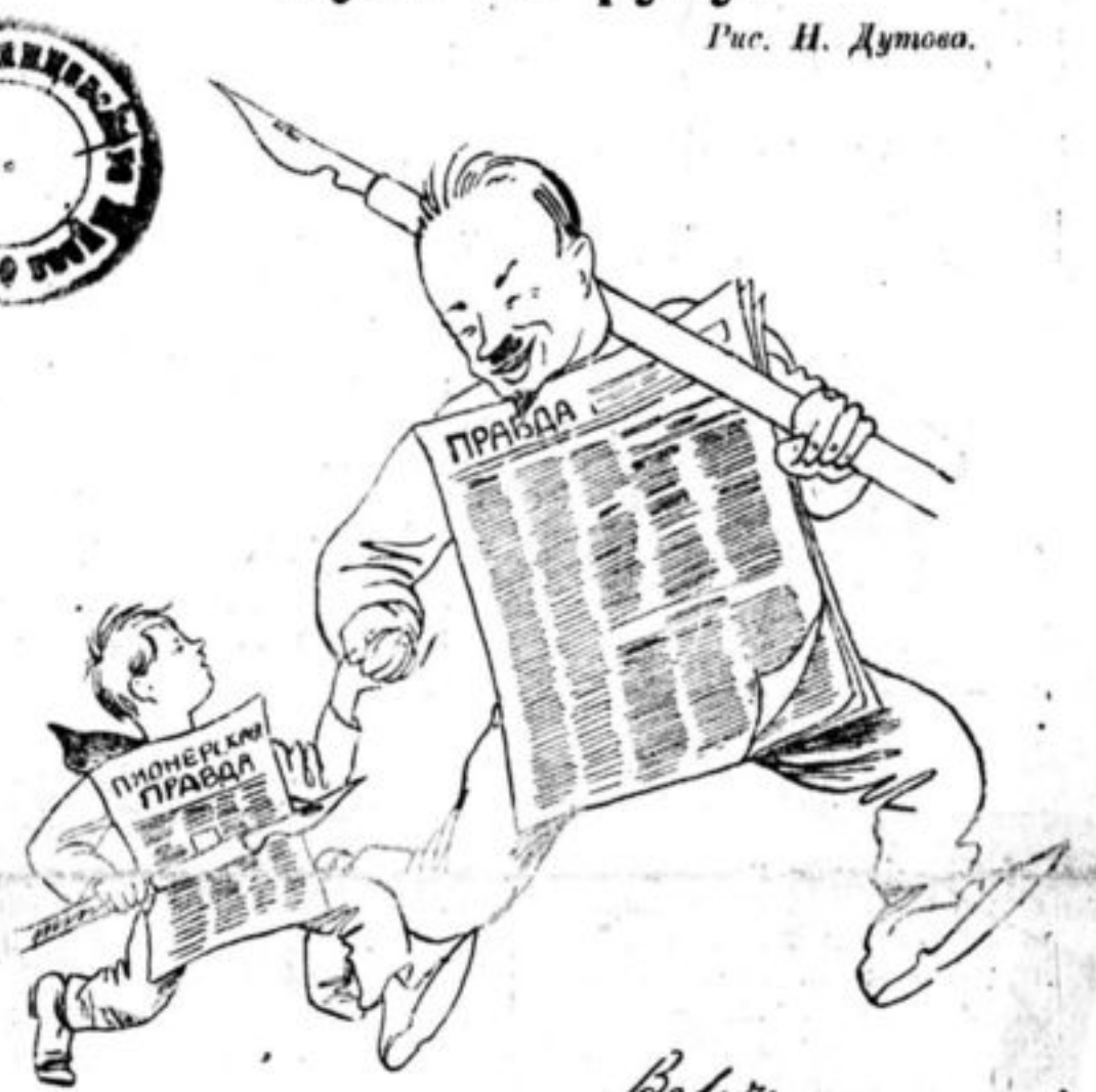
Гон. Бухарин написал на карикатуре: «Валите, догоняйте. Н. Бухарин».