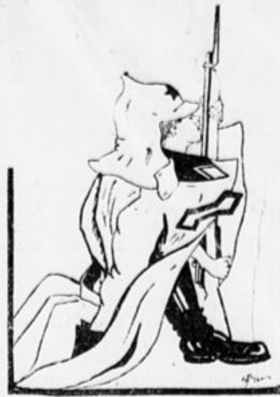
— Будь готов!