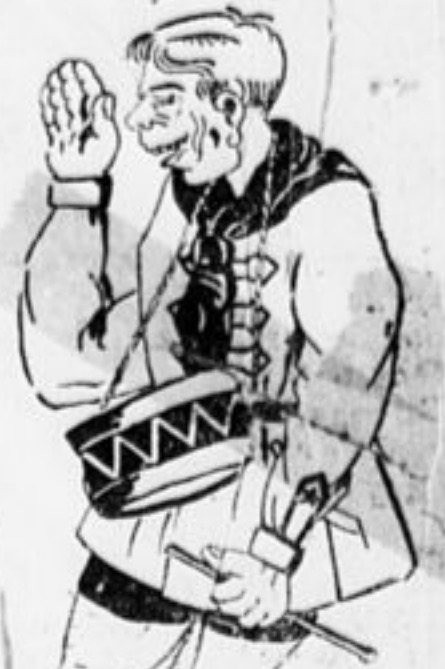
— „Всегда готов!“