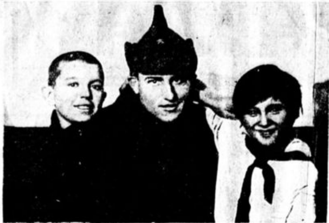
Пионеры в гостях у Буденного.

Красная Армия одна из самых маленьких, но буржуям она страшна. Они боятся ее потому, что в любой момент она может разрастись до многих миллионов: ведь в случае опасности каждый пролетарий возьмет в руки винтовку, чтобы защищать свою красную страну. Она страшна им еще потому, что против нее не захотят драться ни английские, ни французские, ни американские и никакие другие рабочие и крестьяне, забранные буржуями в свои армии.