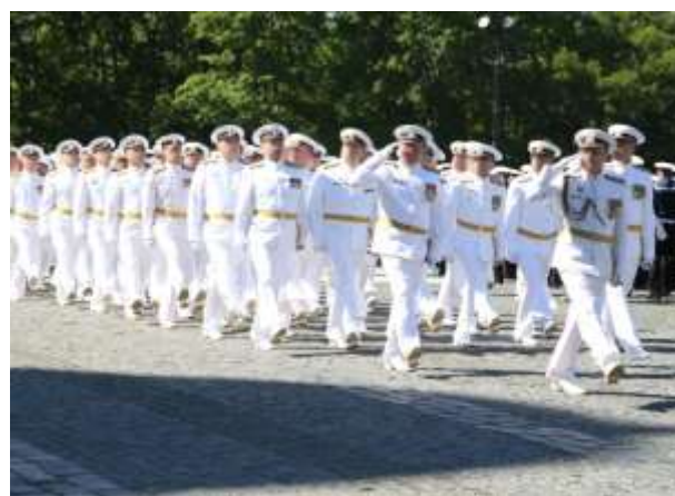
Выпуск на Якорной площади г. Кронштадт

Перечень специальностей, по которым осуществляется набор в институт, представлен в разделе 3.1 «Программы высшего образования» страницы 16–17 и в разделе 3.2 «Программы среднего профессионального образования» страница 18.