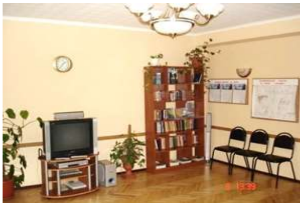
Комната досуга курсантов

Компенсация за поднаем жилья не выплачивается.