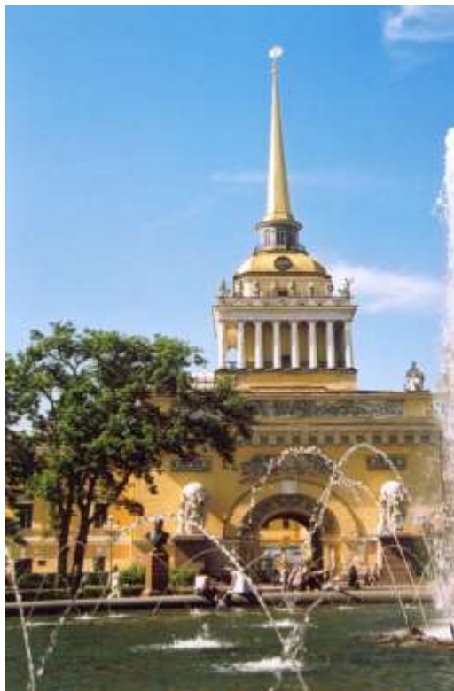
Здание Главного Адмиралтейства

Институт размещается в трех военных городках – в Главном Адмиралтействе г. Санкт-Петербург, в г. Пушкин и в г. Петродворце.