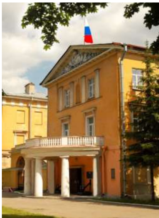
Здание института в г. Пушкин