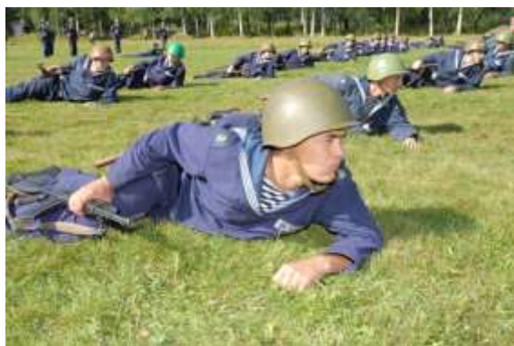
Начальная военно-морская подготовка

В 2012 году приказом Министра обороны Российской Федерации Военно-морской институт радиоэлектроники имени А.С. Попова (г. Петродворец) и Военно-морской инженерный институт (г. Пушкин) были объединены в Военный институт (военно-морской политехнический), который в настоящее время является структурным подразделением ВУНЦ ВМФ «Военно-морская академия».