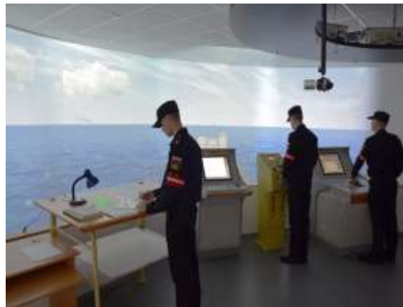
Занятие на комплексном тренажере «Мостик»