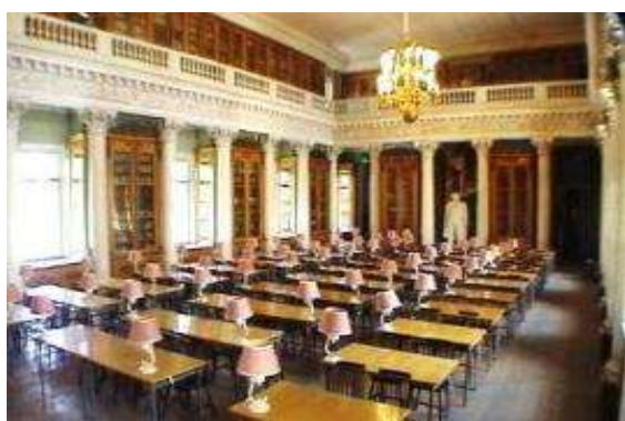
Читальный зал института

Институт имеет клуб, музей, библиотеки, спортивный комплекс с бассейном, площадки для волейбола и баскетбола.