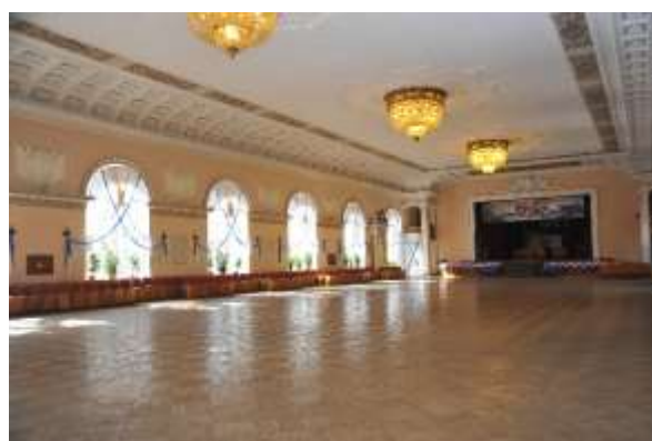
Исторические интерьеры институтов