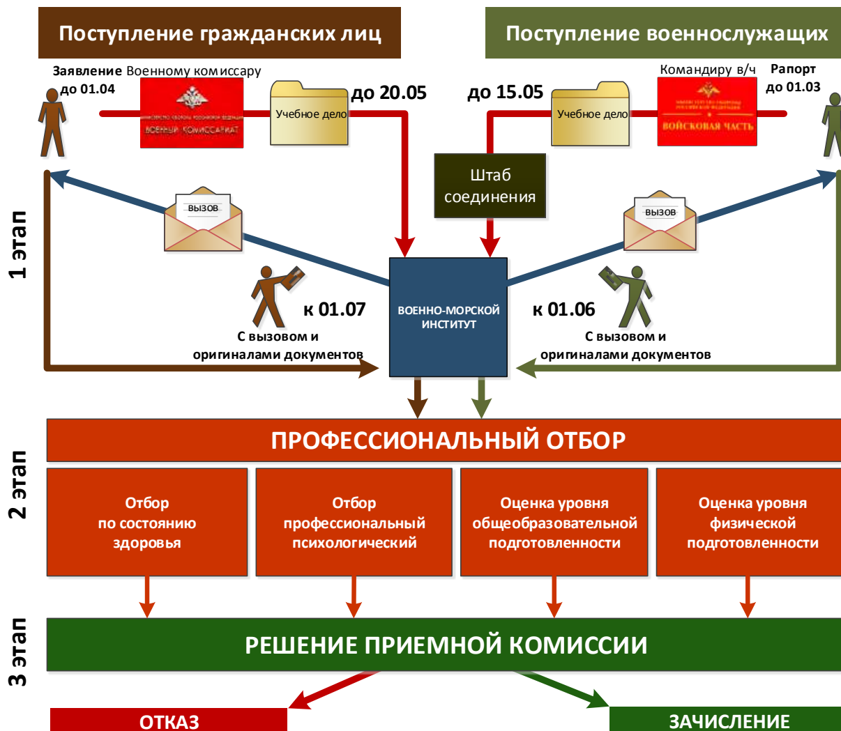
Схема. Порядок поступления

Процесс поступления для гражданских лиц и военнослужащих показан на схеме.