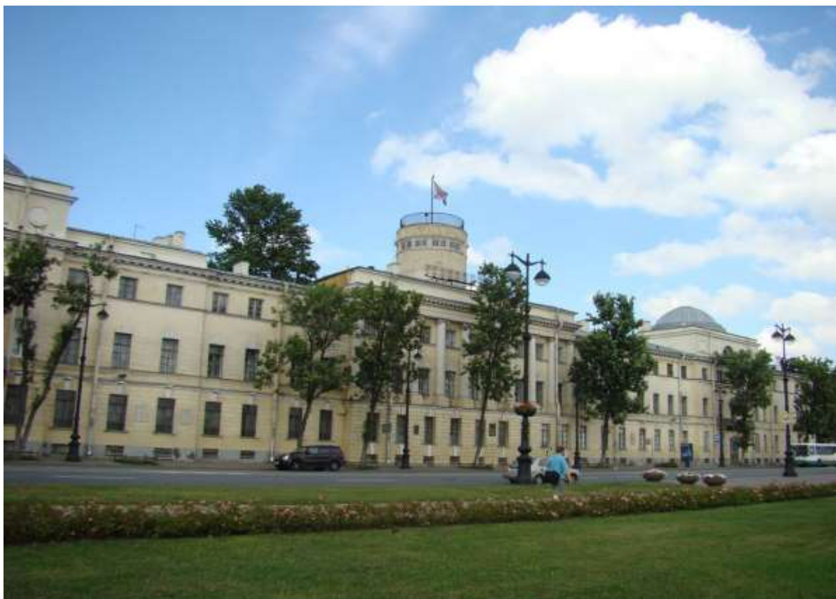
Фасад здания Военного института (военно-морского) ВУНЦ ВМФ «Военно-морская академия»

Свое историческое начало Военный институт (военно-морской) берет от Школы математических и навигацких наук (Навигацкой школы) – первого в российской истории высшего светского учебного заведения, основанного в Москве указом Петра Первого от 25 января 1701 года.