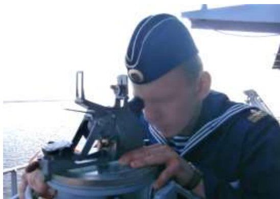
В учебном походе