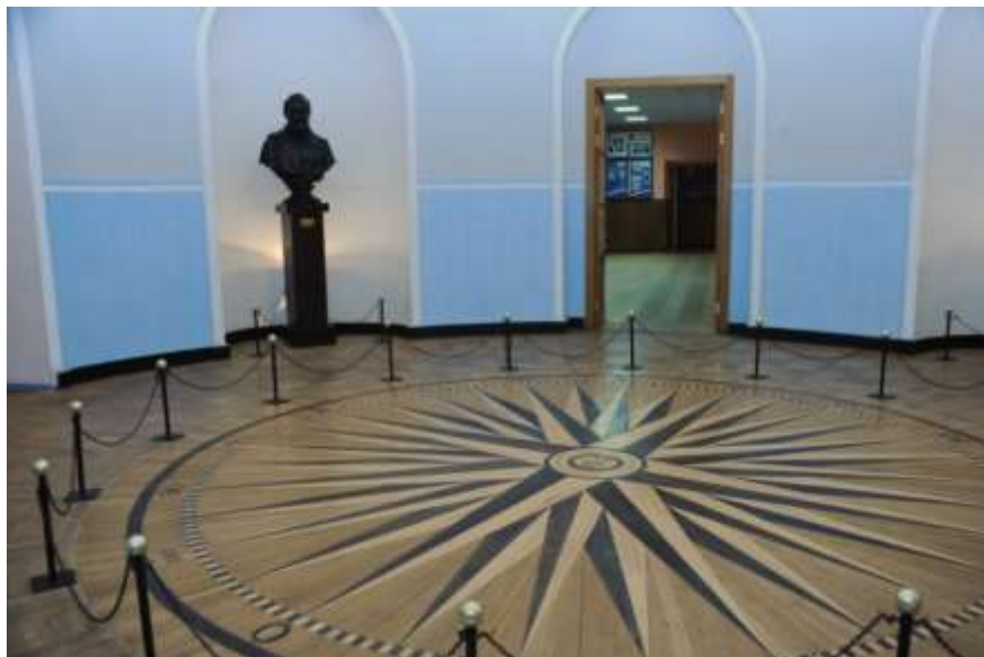
Компасный зал Военного института (военно-морского) ВУНЦ ВМФ «Военно-морская академия»

В 1998 году в результате слияния Высшего военно-морского училища имени Фрунзе и Высшего военно-морского училища подводного плавания имени Ленинского комсомола был создан Санкт-Петербургский военно-морской институт.