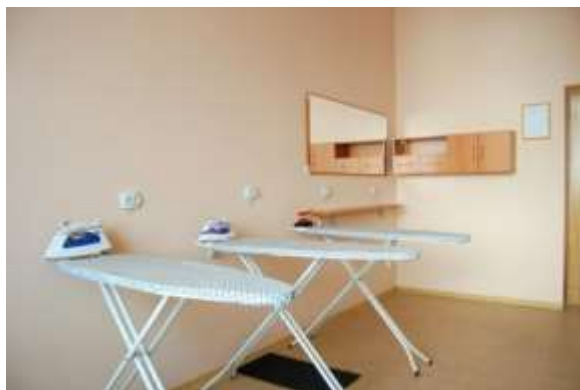
Бытовая комната курсантов женского пола