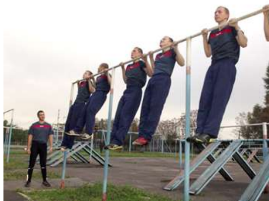
Подтягивание на перекладине

Положение вися фиксируется не менее 1 секунды (продолжить движение после объявления счета).