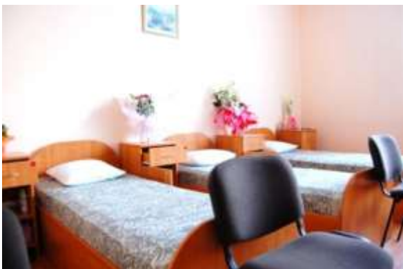
Спальное помещение курсантов женского пола

Курсанты женского пола проживают в отдельных благоустроенных общежитиях.