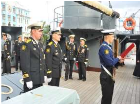
Принятие присяги на Крейсере Аврора

В настоящее время Военный институт (военно-морской) ВУНЦ ВМФ «Военно-морская академия» готовит специалистов для службы на надводных кораблях и подводных лодках. Обучение проводится по программам высшего и среднего профессионального образования, имеется развитая учебно-материальная база. В институте имеются клубы, библиотеки, спортивные комплексы с бассейнами. В процессе обучения курсанты ежегодно проходят практику на боевых и учебных кораблях ВМФ.