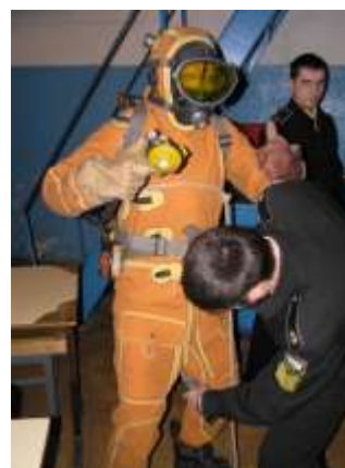
Кафедра водолазной подготовки