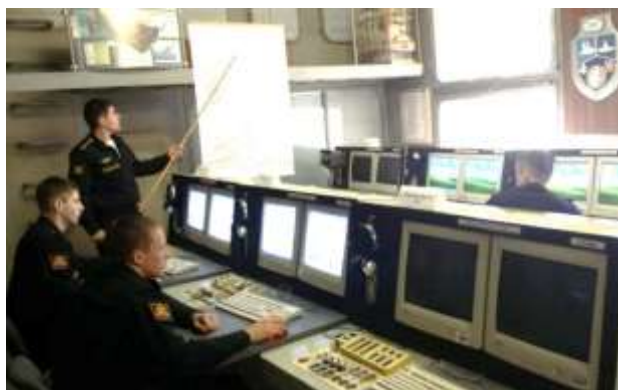
Тактико-специальные учения на тренажерах

Для теоретической и практической подготовки курсантов институт оснащен множеством учебных кабинетов и тренажеров.