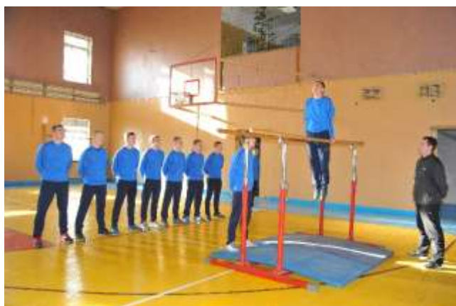
Кафедра физической подготовки