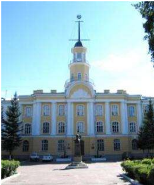
Здание института в г. Петродворце