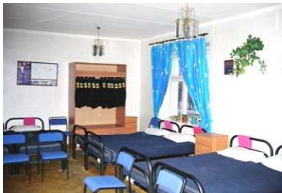
Спальное помещение курсантов

Курсанты женского пола проживают в отдельных благоустроенных общежитиях.