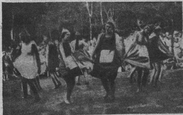
«Юношеский день» германского меньшевистского союза молодежи в Нюрнберге, 11 августа 1923 года.