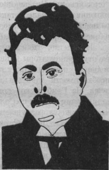
Председатель Исполкома Желтого Интернационала Пит-Фоогд (Голландия).