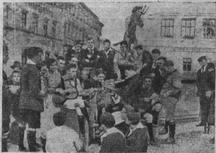
„Юношеский день“ германского меньшевистского союза молодежи в Нюрнберге 11 августа 1923 года.