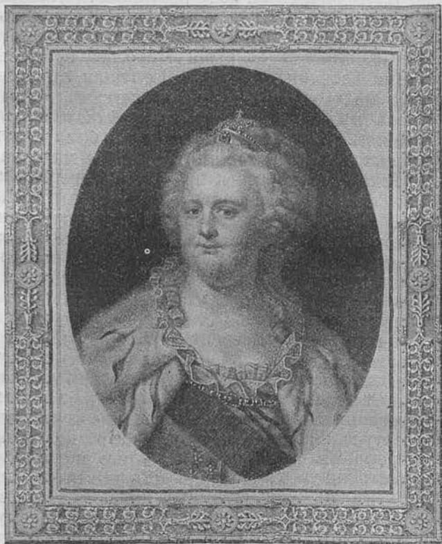
Императрица Екатерина II.

Императрица Екатерина II-ая, выдающаяся женщина, обладавшая государственнымъ умомъ, находившаяся подъ вліяніемъ философскихъ идей Вольтера и Дидро, одушевленная просвѣщенными стремленіями, нападала на невѣжество современницъ, осмѣивая его въ своихъ сатирахъ, но фактически для образованія женщинъ ею сдѣлано было мало; страстная въ своихъ чувствахъ, увлекаясь государственными реформами, она предпочитала все мужское, и русскія женщины мало